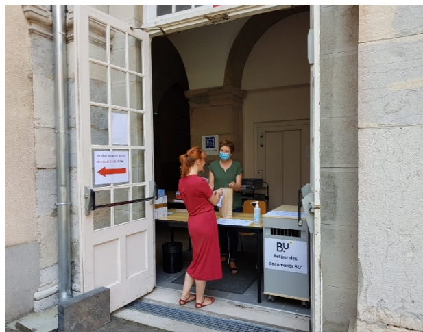
« Documents à emporter » (BU Lettres et sciences humaines)

Continuité des services aux publics pendant la crise sanitaire (développement des ressources en ligne, prêt d'ordinateurs aux étudiants en situation de précarité, nouveaux services « documents à emporter » sur rdv, pré-inscription et quitus en ligne...)