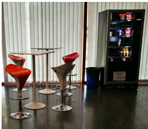
Espace restauration (salle d'exposition, BU Proudhon)